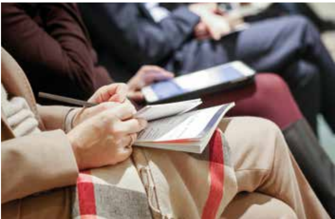
Conférences et ateliers

Un dispositif de communication global avant, pendant et après l'événement : communication print, web et audiovisuelle, newsletters, réseaux sociaux ; publicité et publi-rédactionnel ; ateliers et interviews sponsorisés... Le jour J : des espaces exposants qualitatifs pour mettre en valeur votre marque et vos produits ; des ateliers thématiques qui valorisent vos expertises auprès de votre cœur de cible ; des prestations et un service de réception haut de gamme.