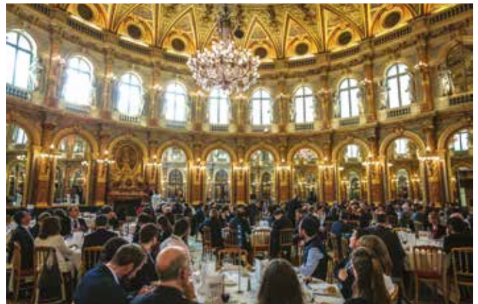
Déjeuner dans le salon Opéra