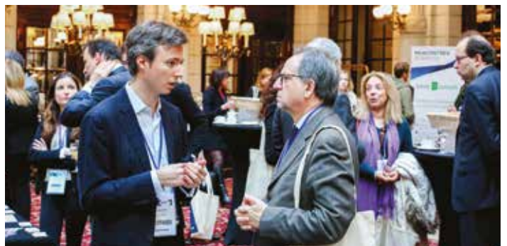
Networking dans l'espace partenaires